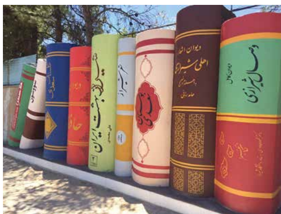
تصویر شماره ۴: المان دیوار کتاب شیراز

المان می‌تواند شامل مجسمه و یا هر کار حجمی باشد که بتواند تصویری از محل در ذهن مخاطب ایجاد و به عنوان خاطره‌ای از شهر یا مکان در ذهن شهر باقی بماند. المان‌های با طراحی زیبا علاوه بر جذابیت محیط می‌تواند در تقویت هویت شهر کمک کند. برای نمونه، با توجه به این‌که شهر صدر به عنوان شهر کتاب و کتاب‌خوانی معرفی شده است، می‌توان از المان‌هایی مانند المان دیوار کتاب شیراز (تصویر شماره ۴) استفاده کرد.