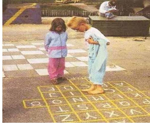
تصاویر شماری ۶ و ۷: تصاویری از پیاده‌رو بازی

امروز بسیاری از پارک‌ها با موضوعی خاص طراحی و به بهره‌برداری می‌رسند. پارک‌هایی مانند پارک انرژی، پارک ترافیک، پارک شطرنج، پارک مشاهیر، پارک ورزش، پارک موسیقی، پارک قرآن و نهج البلاغه و پارک آب و آتش شامل پارک‌های موضوعی هستند. در شهر صدرا به غیر از اکوپارک که در ابتدای شهر واقع شده است، پارک و فضای سبز قابل توجهی در شهر وجود ندارد. می‌توان در نقاط مختلف شهر پارک‌های موضوعی مختلفی با توجه به هویت شهر صدرا احداث کرد. برای مثال می‌توان پارک کتاب و پارک ادبا و مشاهیر شیراز را با توجه به این که شهر صدرا را پایتخت کتاب نامیده‌اند، احداث کرد.