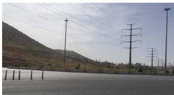
تصویر شماره ۳: میدان امام رضا (ع)، میدان ورودی شهر صدر

با آن مواجه می‌شوند، می‌تواند با استقرار نشانه‌های هویت‌بخش به بهبود ذهنیت از شهر کمک شایانی کند. میدان بهارستان نیز با توجه به موقعیت و اندازه می‌تواند محل استقرار نشانه شهری باشد.