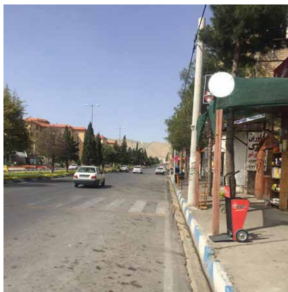
تصویر شماره ۵: بلوار دانش

در شهر جدید صدر باید در خیابان اصلی شهر از قبیل بلوار ایران، بلوار پاسداران، خیابان دانش و خیابان مولانا با توجه به وضعیت خیابان باید تابلوهای تجاری سامان‌دهی شده و پیاده‌روی تقویت شود و فضای امن و جذاب برای عابران پیاده برای حضور و استفاده از فضای پیاده به وجود آید و از این طریق پیاده‌مداری در شهر حاصل شود.