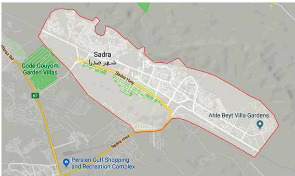
تصویر شماری ۱ : موقعیت شهر جدید صدرا

بنابر آخرین سرشماری نفوس و مسکن جمعیت شهر صدرا به ۸۶۳،۹۱ نفر در سال ۱۳۹۵ رسید. در جدول شماره ۱ زیر روند جمعیت پذیری شهر طی سالیان اخیر مشاهده می‌شود.