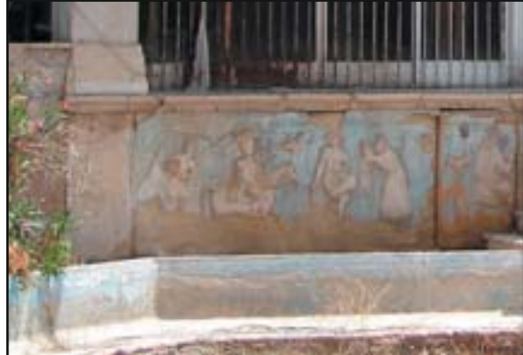
تصویر ۱۳. باغ نو، حجاری روی ازاره کوشک