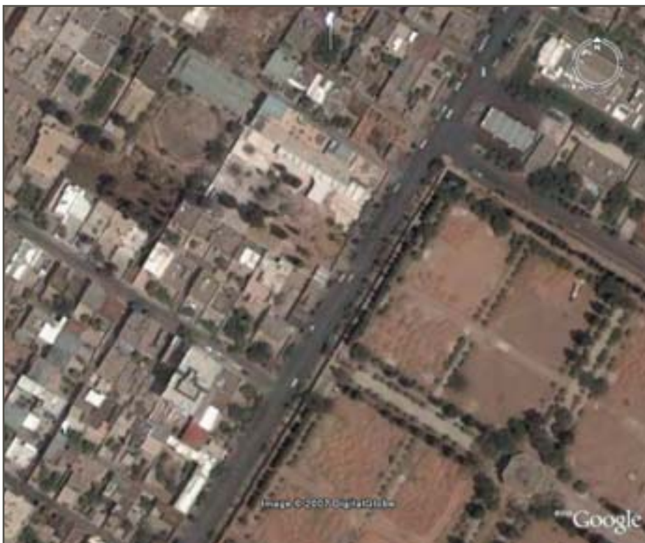
تصویر ۸. عکس ماهواره‌ای از باغ نو و اطراف آن