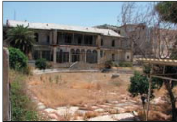
تصویر ۱۱. باغ نو، کوشک و بقایای حوض آن