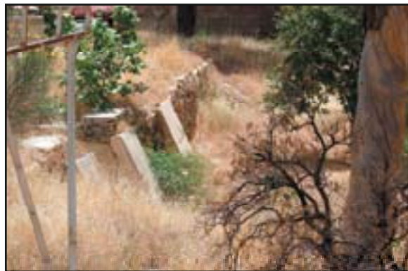
تصویر ۱۵. باغ نو، سنگ‌های آبشار باغ

اصفهان: کتابفروشی نایب. چاپ دوم. ۱۳۲۶ ۶. خوانساری، مهدی. مقتدر، محمدرضا. یآوری، مینوش. باغ ایرانی بازتابی از بهشت. ترجمه مهندسین مشاور آران. تهران: سازمان میراث فرهنگی. ۱۳۸۳ ۷. حسینی فسایی، حاج میرزا حسن. فارسنامه ناصری، ج ۲. تصحیح منصور رستگار فسایی. تهران: امیر کبیر. ۱۳۶۷ ۸. دیالافوا، مادام. سفرنامه، ایران کلد و شوش. ترجمه بهرام فره وشی. تهران: دانشگاه تهران. چاپ سوم. ۱۳۶۴ ۹. روزنامه میرزا محمد کلاتر فارس شامل وقایع قسمت‌های جنوبی ایران از سال ۱۱۴۲ تا ۱۱۹۹ ه.ق. تصحیح عباس اقبال آشتیانی. تهران: طهوری. سنایی. ۱۳۶۲ ۱۰. ریچاردز، فرد. سفرنامه فرد ریچاردز. تهران: علمی و فرهنگی. چاپ دوم. ۱۳۷۹ ۱۱. سیاحت‌نامه مسیو چریکف. ترجمه آیکار مسیحی. تهران: شرکت سهامی کتاب‌های جیبی. ۱۳۵۸ ۱۲. فرصت شیرازی، محمدنصیر. آثار عجم، ج ۲. تصحیح منصور رستگار فسایی. تهران: امیر کبیر. ۱۳۷۷ ۱۳. فلاندن، اوژن. سفرنامه اوژن فلاندن. ترجمه حسین نورصادقی. تهران: اشراقی. چاپ سوم ۱۴. گزُن، جورج. لرد. ایران و قضیه ایران، ج ۲. ترجمه ع. وحید مازندرانی. تهران: بنگاه ترجمه و نشر کتاب. ۱۳۵۰ ۱۵. لوتی، پیر. به سوی اصفهان. ترجمه بدرالدین کتابی. مقدمه محمد مهریار. تهران: اقبال. ۱۳۷۲ ۱۶. مهریار، محمد، شامیل فتح‌الله‌یف، فرهاد فخاری تهرانی، بهرام قدیری. اسناد تصویری شهرهای ایرانی دوره قاجار. تهران: سازمان میراث فرهنگی. ۱۳۷۸ ۱۷. ویلبر، دونالد. باغ‌های ایران و کوشک‌های آن. ترجمه مهین‌دخت صبا. تهران: علمی و فرهنگی. ۱۳۸۴