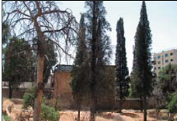
تصویر ۱۴. باغ نو، درختان انتهایی باغ