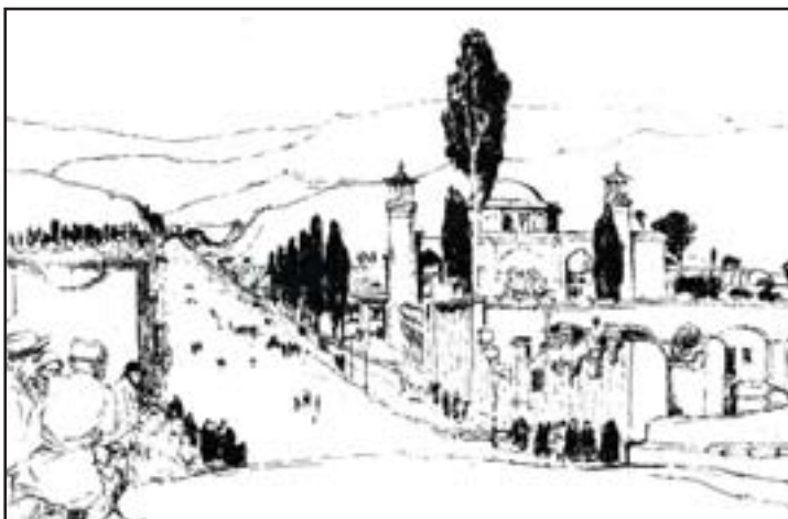
تصویر ۲. شیراز در اوایل دوره

«خیابان عریض و منظمی که شایسته ورود به این شهر حاکم‌نشین است، از میان باغ‌های قشنگ و باصفا عبور می‌کند و به استحکامات شهر منتهی می‌شود.» ۲ شاید اولین متن فارسی که از چهارباغ شیراز نام برده است، روزنامه میرزا محمد کلانتر فارس باشد که درباره وقایع زمان حضور افغان‌ها در ایران تا اواخر دوران زندیه است. «...تکایای سمت جعفرآباد و مصلی و چهارباغ و باغات سرکت و محمودآباد و قوام‌آباد و خلخان و دلگشا و غیرذلک که العلم عندالله به صد قطعه معمور و مغروس بود...» ۳