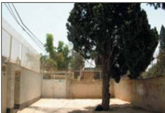
تصویر ۹. باغ نو، ورودی فعلی و درخت آن در بیرون باغ