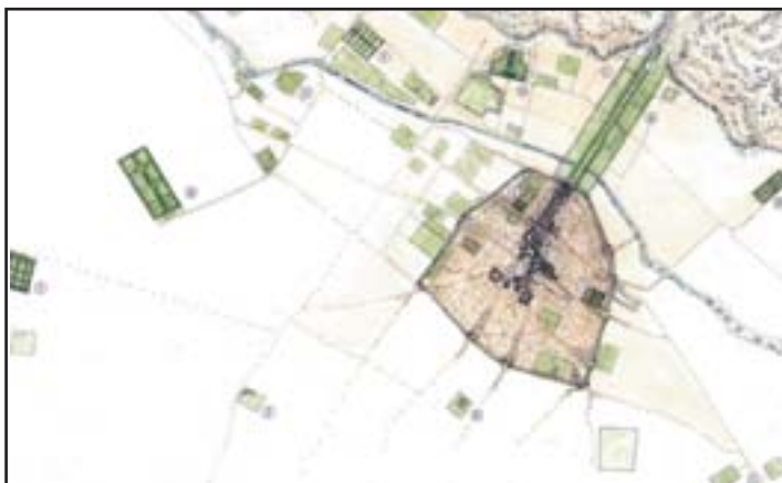
تصویر ۱. چهارباغ ورودی شیراز قرن

(تصویر ۱ و ۲) این خیابان را جهانگردانی چون شاردن و هربرت و تاورنیه، در دوره صفوی، به خوبی توصیف کرده‌اند. به‌طور مثال، تاورنیه در سال ۱۰۴۸ ه.ق درباره این خیابان چنین گفته است؛ «در طرفین خیابان، از ابتدای مسجد تا پای کوه، باغ‌هایی چند بنا شده که در دیوار آنها در فاصله‌های معین دره‌هایی مقابل یکدیگر باز شده و بالای سر هر در، چند اتاق ساخته‌اند که از یک طرف مشرف به خیابان و از سوی دیگر به باغ باز می‌شود. محوطه داخل باغ‌ها از درختان سرو به خط مستقیم خیابان‌بندی شده است.» ۱