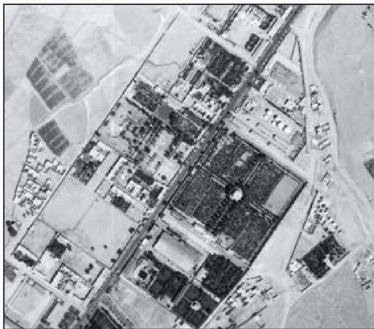
تصویر ۴. باغ نو، عکس هوایی ۱۳۳۵

در مطالب این متن چند نکته مشترک با متن فارسنامه به چشم می‌خورد؛ در این جا نیز به عمارت دورویه، استخر بزرگ، زمین پله‌پله‌ای باغ، درختان میوه، و آبشارها اشاره شده است. از نکات دیگر، اشاره به اندازه حوض، فواره‌ها، فضاهای کوشک اصلی، عمارت سردر، و ساختمان‌های جنبی است، همچنین مشخص می‌شود که باغ‌های مهم دیگری به باغ نو متصل بودند که شاید روزگاری جزء آن به شمار می‌رفتند.