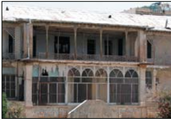
تصویر ۱۲. باغ نو، تغییرات کوشک در حال حاضر