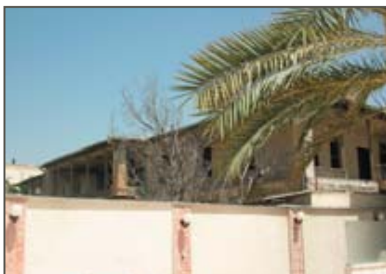
تصویر ۱۰. باغ نو، دید از هتل سعدی در شرق آن